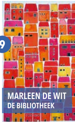
MARLEEN DE WIT DE BIBLIOTHEEK